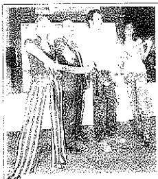
Canalis e Corvaglia alla Fiera

con un saldo positivo di oltre 3 miliardi di euro. Il 34% del valore dell'export è fornito dai vini Doc (per 1,2 miliardi di euro), il 45% dai vini da tavola e l'11% dai vini spumanti. Da segnalare il record della Sicilia. Duecentoquarantatré aziende espongono, su una superficie di 8mila metri quadrati, oltre duemila etichette. Il Nero d'Avola si piazza al quarto posto della top ten nazionale degli acquisti. Con +1,9% vale oltre 26 milioni di euro.